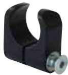
Rörklämma Ø25 mm Art.nr HW310-25