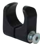
Rörklämma Ø25 mm Art.nr HW310-25