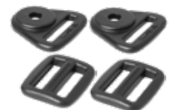
Montering för band följer med bältet